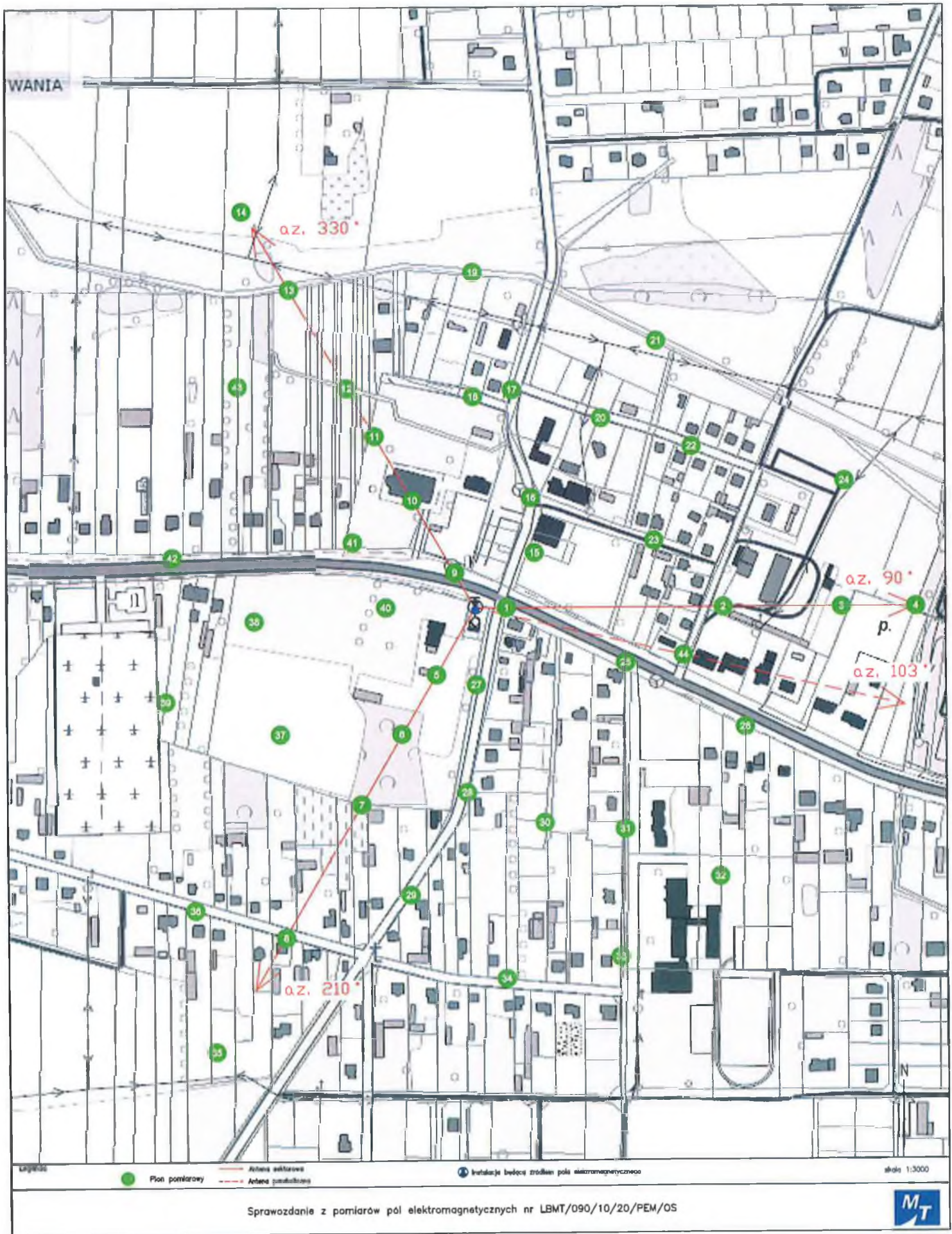
Rys.1 Lokalizacja pionów pomiarowych